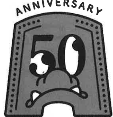
大宰府史跡発掘50年

問 3 古代に置かれた大宰府は、太宰府市の地名の由来ともなりましたが、どんなものだったでしょうか。